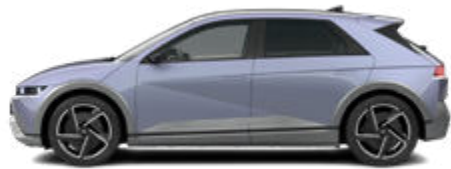
Meta Blue Pearl