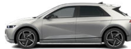
Gravity Gold Matte