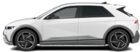
Aufpreis € 390,- Atlas White