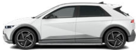
Atlas White Matte