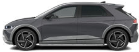
Ecotronic Gray Pearl