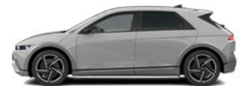
Cyber Gray Metallic