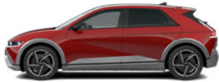
ohne Aufpreis Ultimate Red Metallic