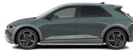
Digital Teal-Green Pearl