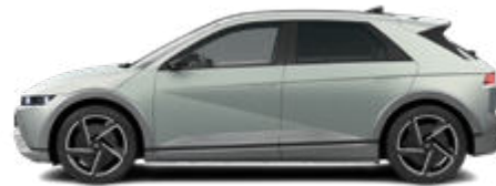
Celadon Gray Matte