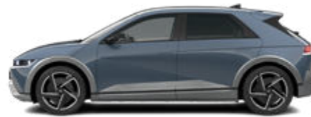
Lucid Blue Pearl